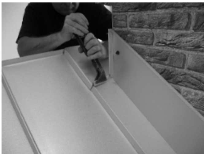
10.Kläm ihop samtliga falsar ordentligt.