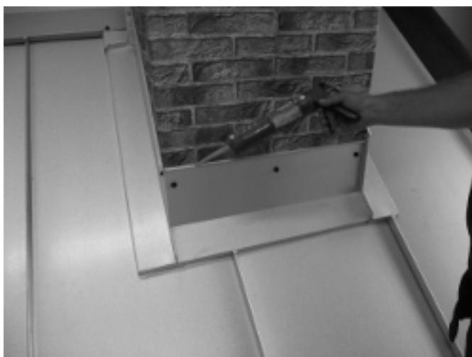
12.Slutligen foga ovansidansidan runt samtliga plåtar så att det blir riktigt tätt.